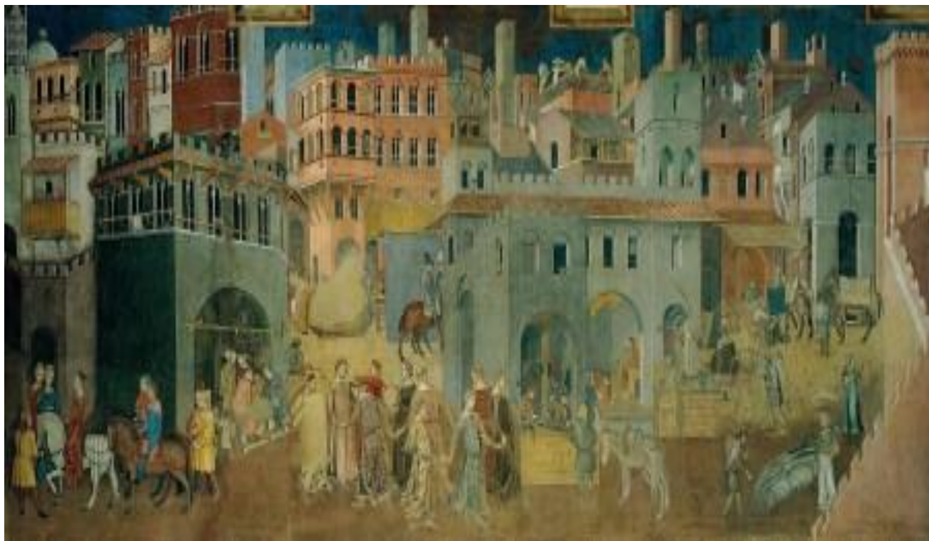
Ambrogio Lorenzetti. Los efectos del buen gobierno en la ciudad (1338- 1340)